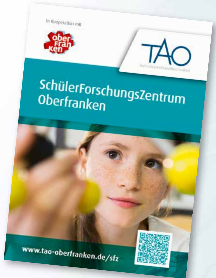
Workshop im TAO-Schülerforschungszentrum

Die vom StMBKWK mit Hilfe der Regierung von Oberfranken genehmigte Unterstützung der Initiative durch Bewilligung von Teilfreistellungen jeweils einer Lehrerin bzw. eines Lehrers je Universität bzw. Hochschule für den direkten Kontakt zwischen den Schulen der Region und den Anbietern im Schülerforschungszentrum hat sich als äußerst hilfreich erwiesen. Die Kontaktlehrerinnen und -lehrer arbeiten eng vernetzt. Von dieser Zusammenarbeit profitieren alle Aktivitäten rund um das TAO-SFZ. Das TAO-SFZ Oberfranken ist das einzige dezentral organisierte Schülerforschungszentrum in Deutschland!