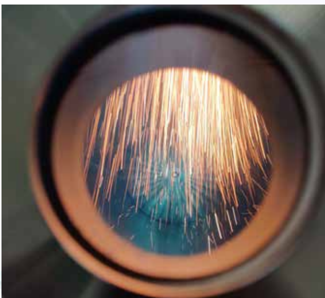
Herstellungsprozess der Metallpulver durch thermische Spritzen

Es konnte bereits ein Raman Mikroskop vom Typ SENTERRA II der Firma Bruker im ZMW in Betrieb genommen werden. Weiterhin konnten zwei Großgeräteanträge bei der DFG erfolgreich eingeworben werden, was nur durch die Kofinanzierung der TAO möglich war. Es handelt sich dabei, um eine einzigartige Hochtemperatur-Universalprüfmaschine und eine Prüfanlage für die simultane thermische Analyse von TGA/DSC Messungen, sowie Gasanalyse mittels FTIR und GC-MS. Die Universalprüfanlage wird es in Zukunft erlauben die innovative Forschung auf dem Gebiet der mechanischen Materialcharakterisierung von Druck-, Biege- und Zug-Eigenschaften bei Temperaturen bis 1600 °C in unterschiedlichen Atmosphären zu realisieren. Die simultane Durchführung einer TG/DSC Messung mit angeschlossener FTIR und Gaschromatographie mit Massenspektrometrie-Kopplung stellt eine herausragende Analysemethode vom aktuellen Stand der Technik dar. Alle angeschafften Geräte werden für Firmen und Forschungs- und Entwicklungstätigkeiten in Oberfranken zur Verfügung stehen.