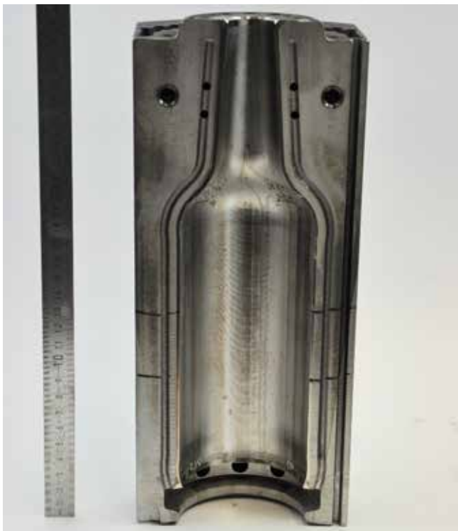
Glasform aus Metall bereitgestellt von der oberfränkischen Firma aus dem Raum Coburg

Im Rahmen einer beauftragten Untersuchung wurden für eine oberfränkische Firma (nahe Coburg) Glasformen aus Metall zur Prozessoptimierung auf Reaktionen an der Grenzfläche zwischen Form und dem heißen verformbaren Glas näher untersucht. Es wurden mehrere Schlitze aus Formen entnommen und Mikrostrukturanalysen mittels Rasterelektronenmikroskopie durchgeführt sowie mehrere Analysen zur Elementzusammensetzung mit EDX.