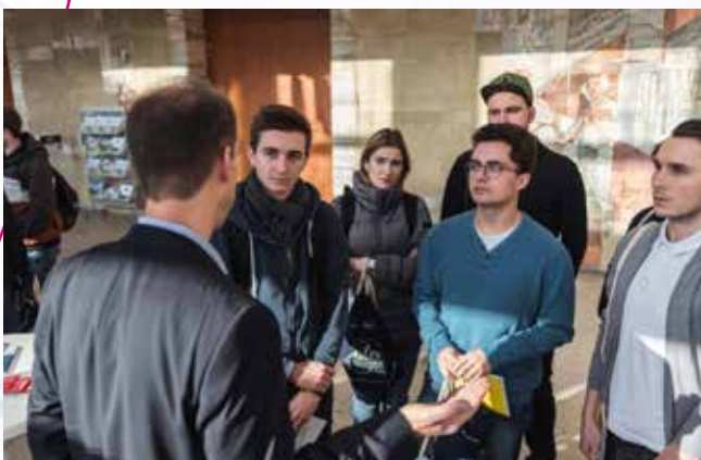
Der Oberfränkische Mastertag 2019 war erfolgreich!

Der TAO-Mastertag in diesem Jahr war leider nur teilweise erfolgreich. Die Rückmeldungen der Teilnehmer*innen und der Referent*innen war gemischt: Konzept und inhaltliche Umsetzung wurden ebenso gelobt, wie der persönliche Kontakt. Bedauerlicherweise lies die Besucherzahl zu wünschen übrig. So ist die Werbung für die TAO-Partnerhochschulen einerseits gelungen, andererseits ist der vorbereitende inhaltliche und organisatorische Aufwand sehr hoch. Deshalb hat sich der TAO-Lenkungsrat dafür ausgesprochen, das Konzept grundsätzlich zu überdenken. Eine Fortführung wird digital stattfinden bei gleichzeitiger gemeinsamer Bespielung der existierenden Mastermessen mit einem gemeinsamen Auftritt.